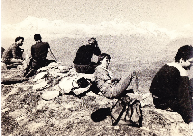
India. Uitzicht op de Himalaya

Geleidelijk krijg ik steeds meer moeite met de ogenschijnlijke onverschilligheid waarmee onze wereld van schrijnende verschillen voor lief wordt genomen. Begin 1980, de lerarenopleiding heb ik vroegtijdig kunnen beëindigen, maak ik een reis door het Verre Oosten (Pakistan, India, Sri Lanka en Nepal).