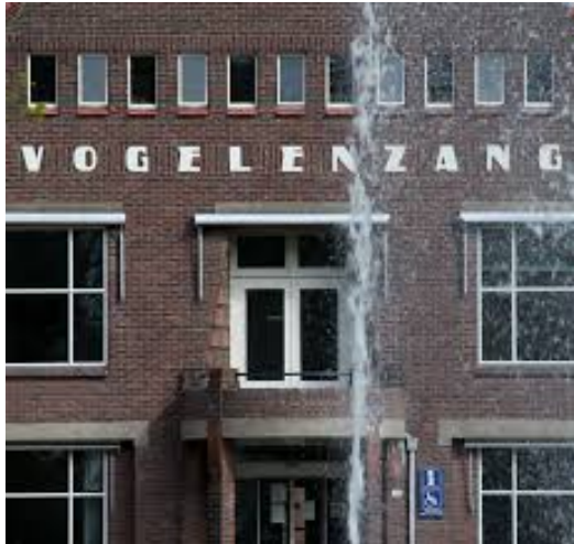
Psychiatrisch ziekenhuis, 1982

Over de 'V' van vogel in automerken als VW, Volvo en BMW schrijf ik In 'De Ornitholoog' het volgende: 'In de War vragen haast en verkeer intussen steeds meer aandacht. Gekooïd in gestaalde vogels zitten veelal kostbare boomklevers me tussen nest en volièrre op de hielen. Steeds vaker venijnig kijkend, soms geblindeerd. Links en rechts halen ze me in. Inhalig. Veel boomklevers hebben zich getooid met brandmerken, waaraan ze absolute vrijheid (auto's met een 'V') of recht op de halve War (Audi's) ontlennen. Aanvankelijk kan ik de verleiding om mee te haasten niet weerstaan, gaandeweg wel. Een file gestaalde vogels aan de overzijde onthaast' (De Ornitholoog, 00.08).