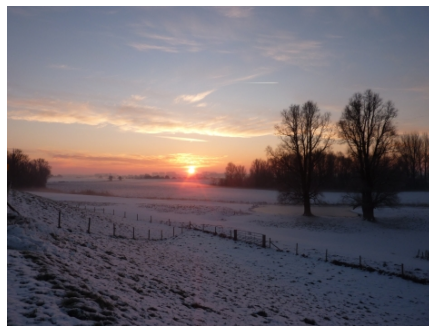
Wijk bij Duurstede